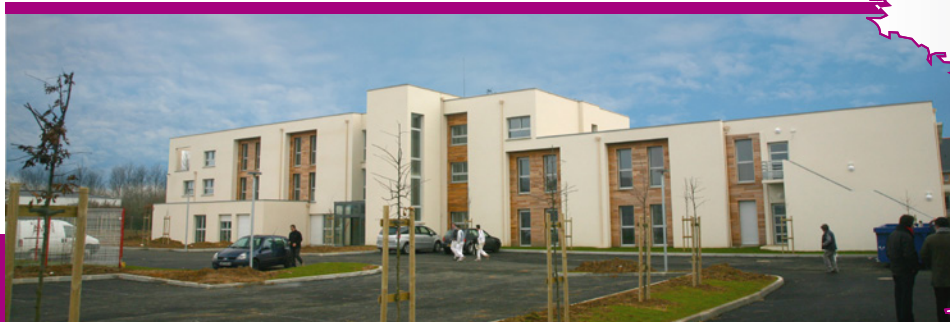
Enity, exploitation de la résidence Beauséjour Châteauneuf-sur-Sarthe